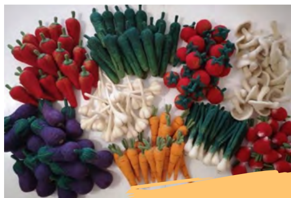
Плъстене на вълна